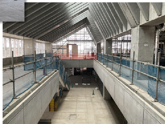
▼2階から見下ろした様子

新庁舎の開庁は令和9年5月頃を予定しています。 引き続き、書類や物品の整理にご協力をお願いします！