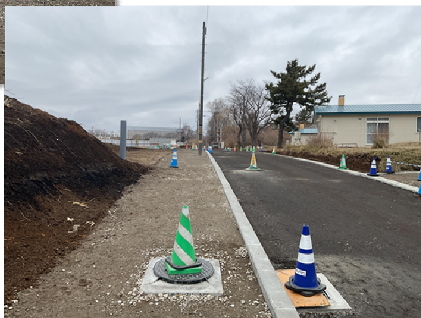
▼周辺道路整備の様子

新庁舎についてのご意見・ご質問がありましたら 本庁舎整備推進グループまでお願いします！