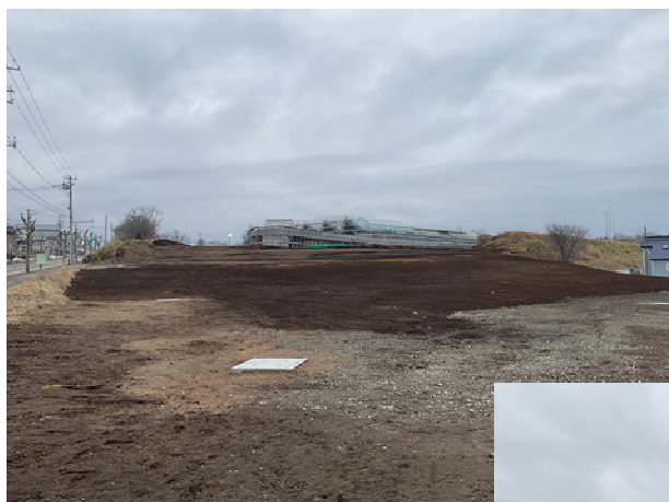
▲外構工事の様子 (旧労働福祉センター跡地)

また、庁舎の東側の市道（ファミリーマート横）については、歩道を新設し、安全な通勤路・通学路となるよう整備を進めています。