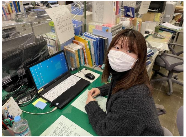
令和3年度入庁 渡島総合振興局保健環境部社会福祉課 (現所属：中央児童相談所子ども支援課)

私が社会福祉職員を目指した理由は、大学で専攻していた心理学を活かし、問題に介入し支援することで困っている方を支えたいと思ったからです。また、大学では児童発達支援事業所で実習を経験し、これまで学んだことを活かしたいという気持ちがより強くなり、社会福祉職員を目指しました。