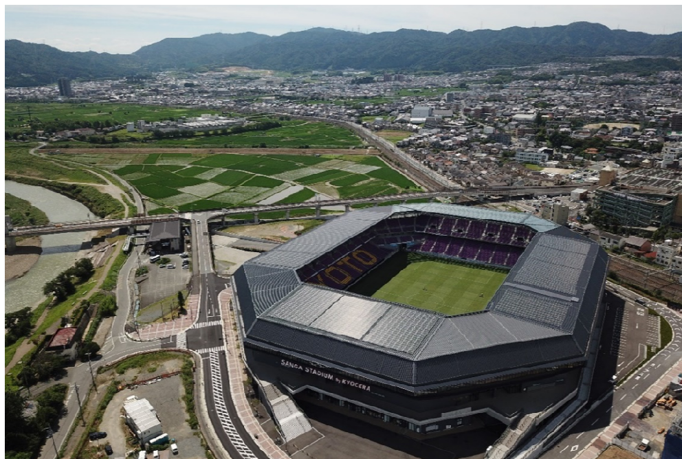
↑サンガスタジアム by KYOCERA (京都サンガF.C.のホームスタジアム)