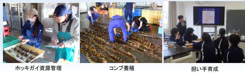
ホッキガイ資源管理