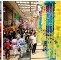
七夕まつり 7月上旬