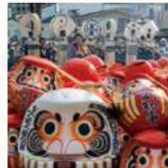
初市まつり 毎年1月9日

前橋初市まつり、前橋七夕まつり、前橋花火大会、前橋まつりは前橋市を代表する四大イベント。毎年多くの市民や観光客が訪れます。