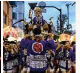
前橋まつり 10月上旬